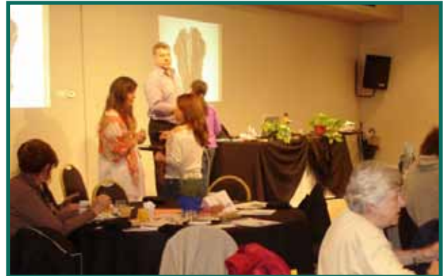
Jornadas de aprendizaje vivencial, donde nos capacitamos de manera distendida y consciente