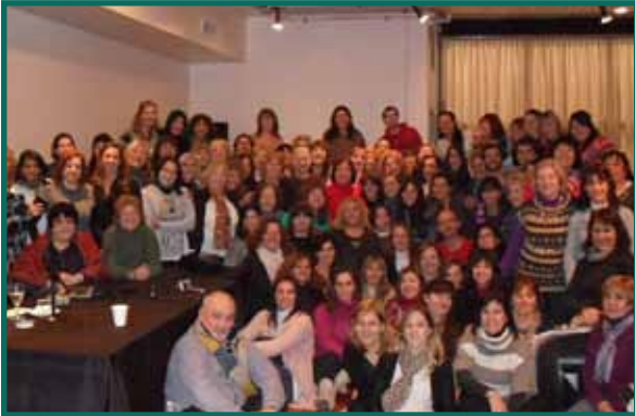
Una multitud de consultores y practitioners eligen capacitarse con Londner's y FULTENA

El sueño de aprender, compartir, divertirse y llegar cada día a miles de personas con las propuestas de capacitación en terapias naturales más novedosas y profundas es nuestra misión, y lo que puede respirarse en cada una de nuestras actividades.