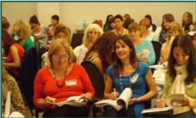
Incorporamos nuevas herramientas terapéuticas, con ejercicios vivenciales y actividades prácticas

Este año recibiremos la visita internacional de Talita Margonari, hija de la creadora de los Florales de Saint Germain